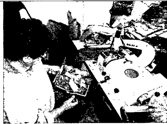
Foto 10. Recolección de retazos resultado del corte manual.