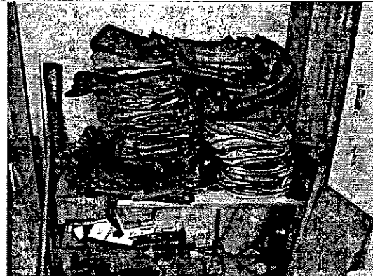
Foto 4. Productos en proceso de confección.