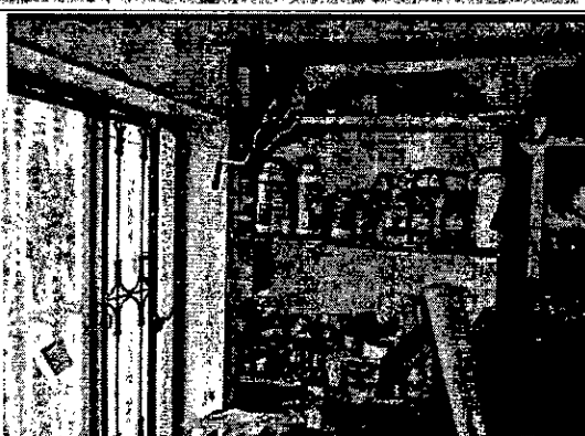
Foto 5. Materia prima empleada en la confección.