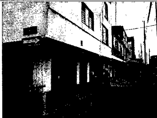
Foto 1. Vista general del predio.