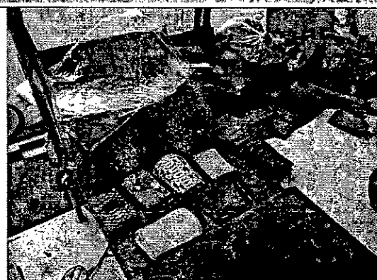
Foto 6. Cortes de piel para emplear en la confección.