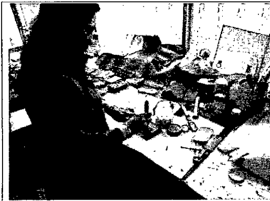
Foto 9. Aplicación manual de solución de caucho.