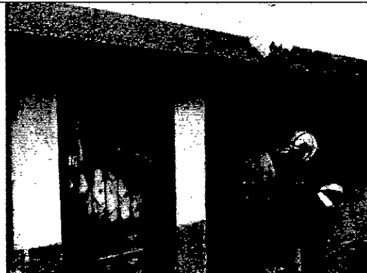
Foto 2. Detalle de la nomenclatura del predio.