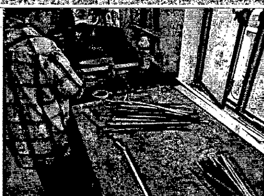
Foto 7. Proceso de corte manual de pieles.