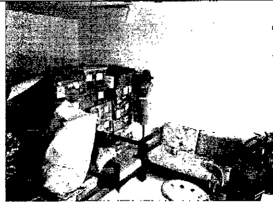
Foto 12. Área de almacenamiento de materias primas y productos terminados.