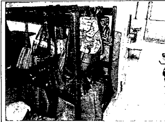
Foto 11. Almacenamiento temporal de productos terminados.