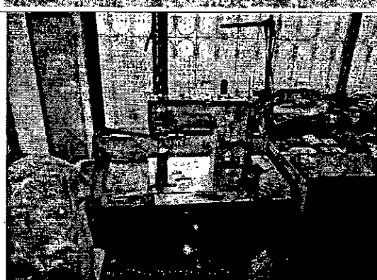
Foto 8. Máquina empleada en la costura.